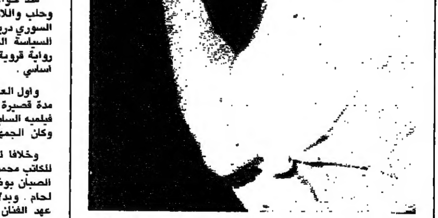
الممثل الاميركي سيلفستر ستالوني يمازح المصمم الايطالي جيباني فيراشي، قبيل عرض الازياء الذي اقيم في ١٠ تموز الحادي لموديلات فصل الربيع.

اما في «كفرون» فيعتمد دريد لحام اساساً على الاطفال لإسقاط افعالهم على الكبار من خلال حدث الكبار على الاقتداء. يعمل الصغار الذين ساعدوا العدالة على اظهار الحق وتبرئة البريء.